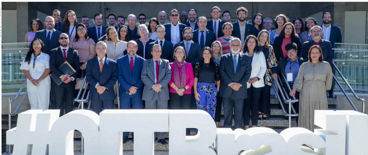
Parcerias buscam alcançar a Meta 8.7