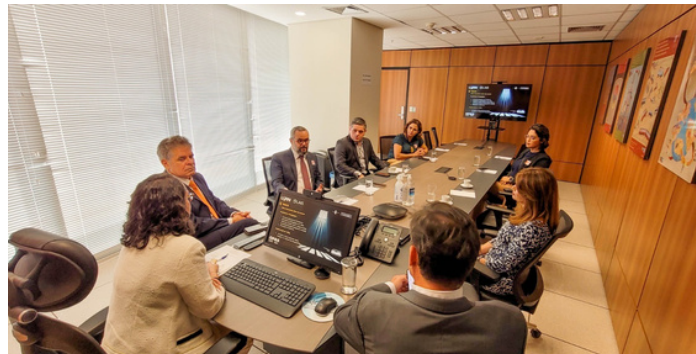
Precariedade e baixa qualificação marcam serviços de saúde nas prisões