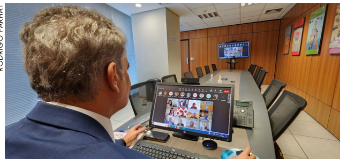
Trabalho institucional organizado